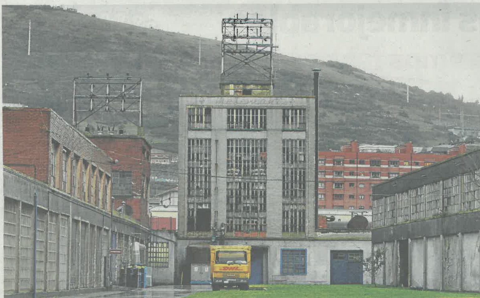
La torre de procesamiento químico de Mefesa se levanta majestuosa sobre Zorrozaurre.