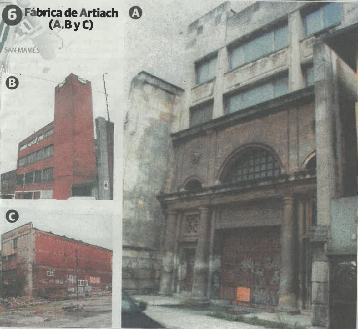
GRÁFICO IRANTZU CARRAL

de Agemasa, a orillas del canal, el del número 47 bis de la ribera ni el edificio de Fincas Nervión, el más próximo a la punta de Zorrozaurre, que tiene estética de chalé.