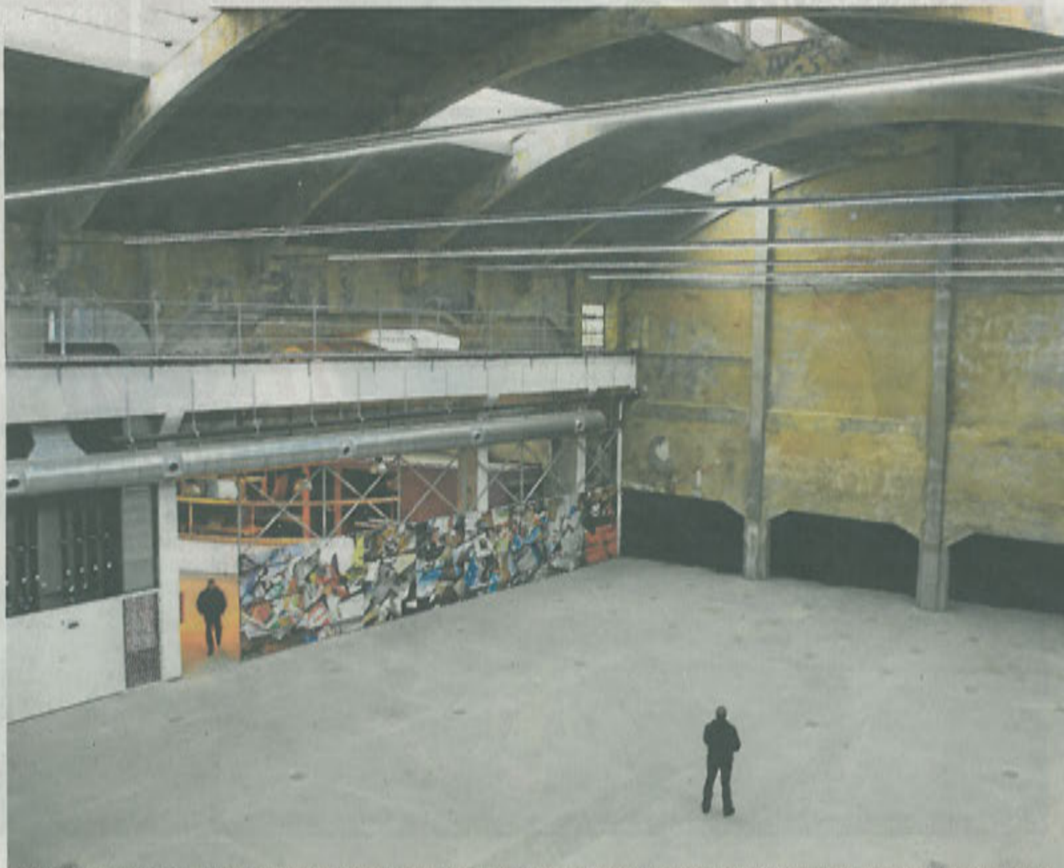
La cubierta abovedada con lucernarios es la seña de identidad de la nave, un espacio diáfano con estética industrial.

En diciembre de 2010, La Hacería firmó un contrato de alquiler para