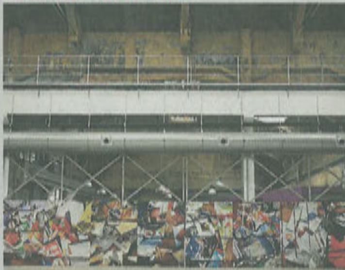
Estos paneles separan la nave principal de la zona de bar.