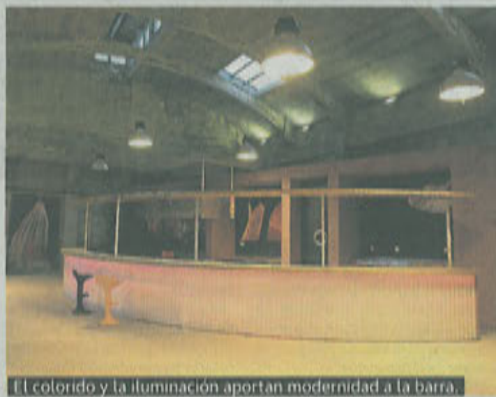
El colorido y la iluminación aportan modernidad a la barra.

Campos ni que sea un centro de producción como el de Otxarkoaga».