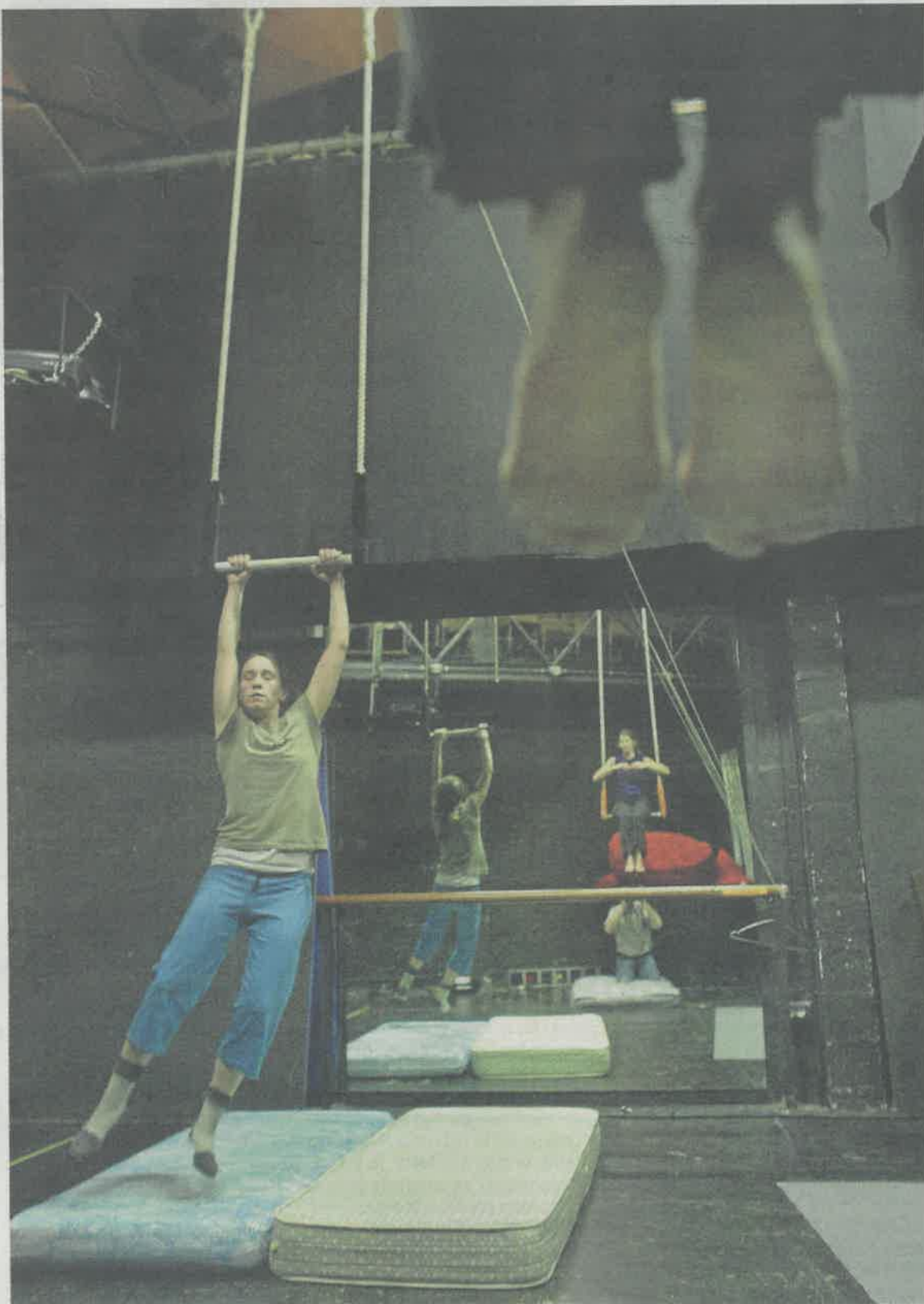
Ensayo de un espectáculo de danza en La Hacería, primer centro cultural de Zorrozaurre.

El pabellón que tiene los días contados «ha cumplido su función y vamos a por algo nuevo», constata Gómez-Álvarez. El derribo siempre ha